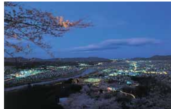
船岡城址公園からみた、柴田町の夜景