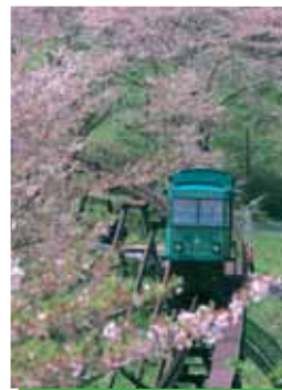
桜の中を走るスロープカー